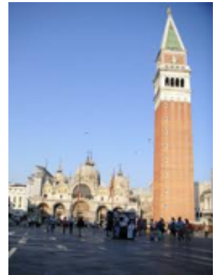
ベネチアの街並み