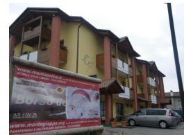
ランディング横のホテル