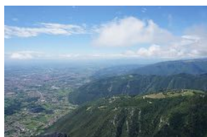
グラツパ上空風景